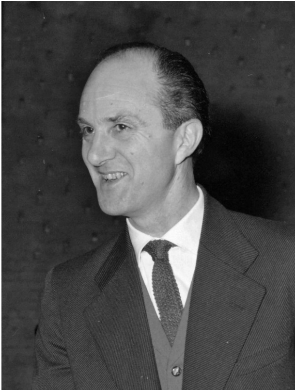
Rudolf Escher, 1960