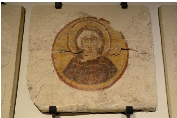
3.1 De oudste Libanese afbeelding van Maria, Tyrus