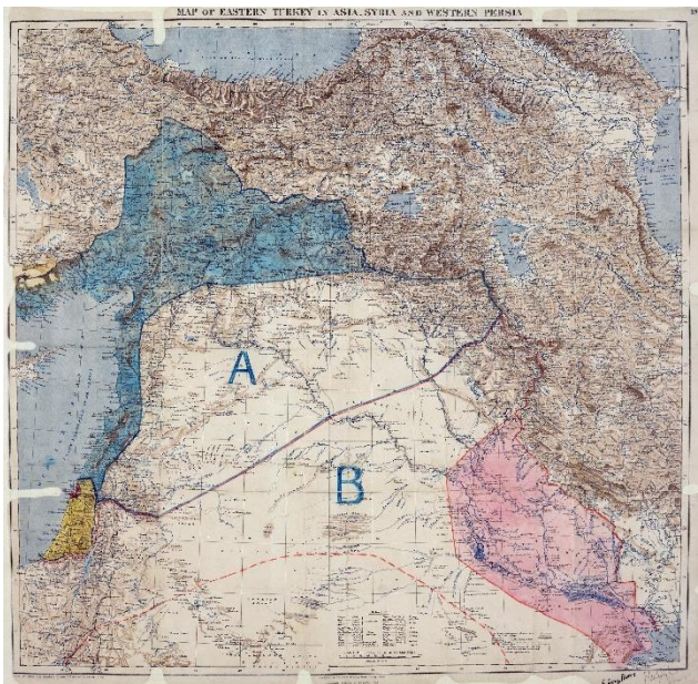
7.1 Het Sykes-Picot-verdrag