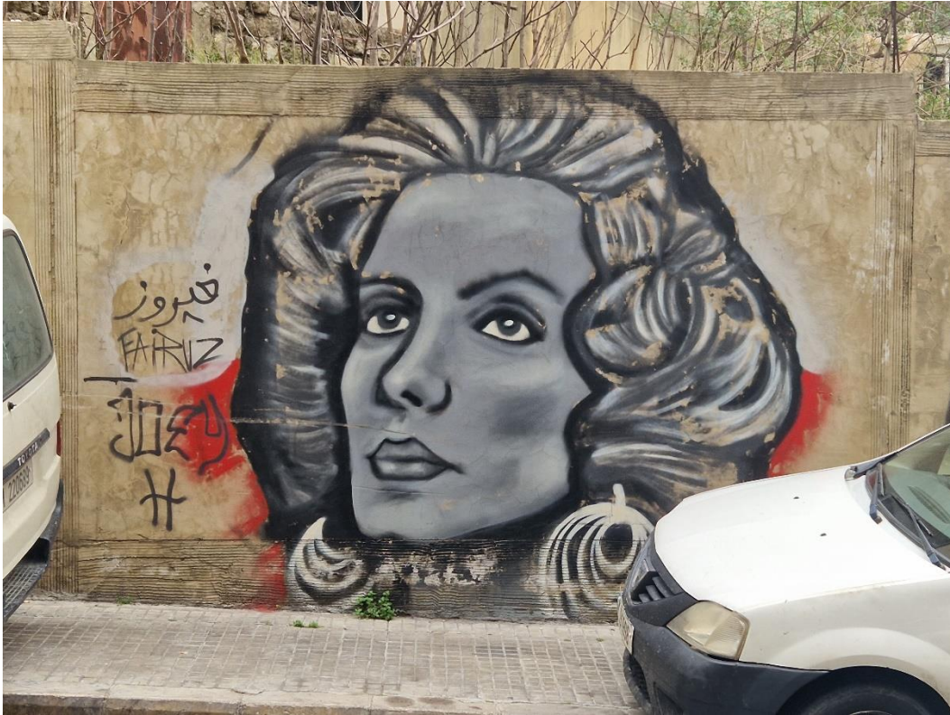
10.2 De zangeres Fayrouz