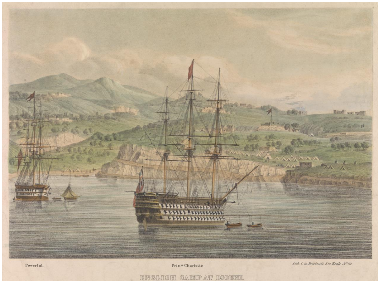
6.1 De landing bij Jounieh