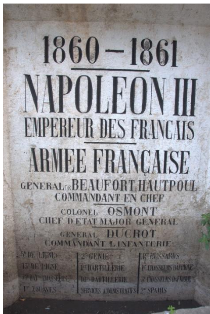
6.2 Het monument voor Napoleon III aan de Nahr al-Kalb