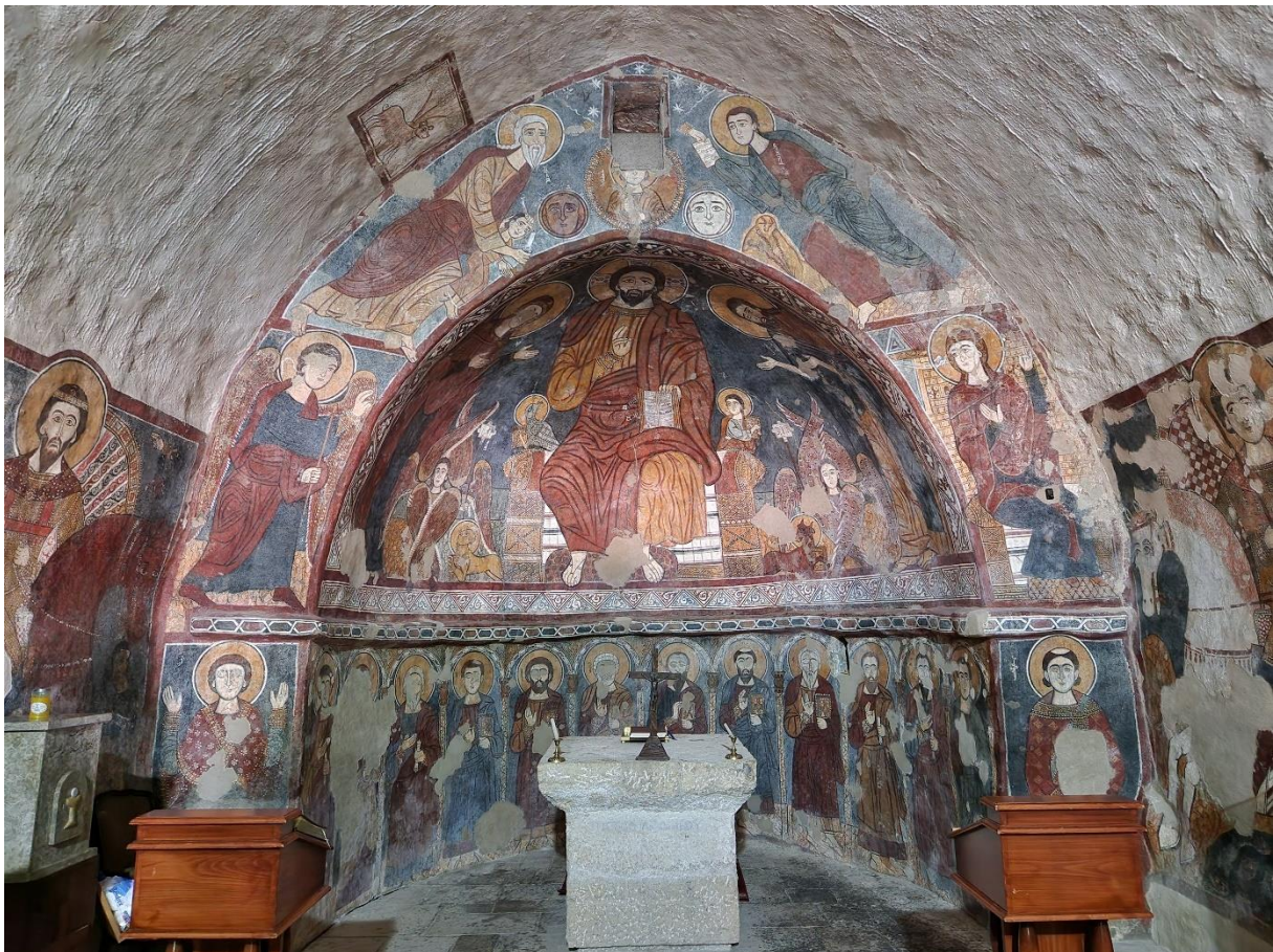
4.2 De maronitische kerk van Mar Tadros in Bahdidat