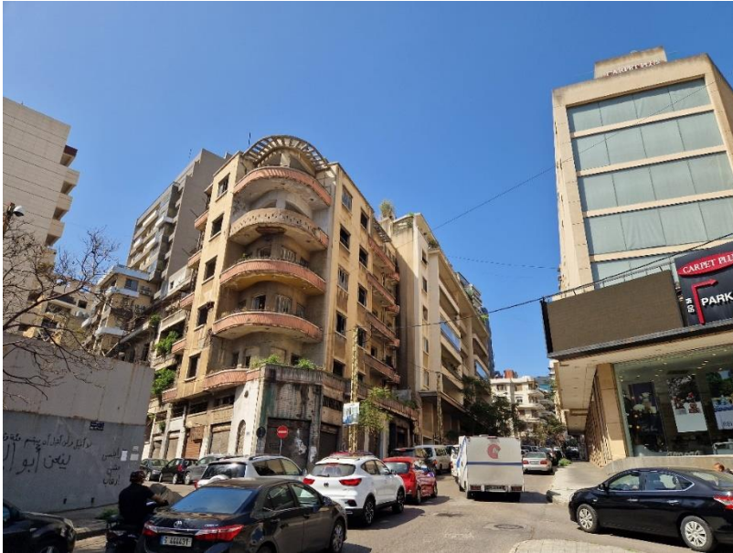
8.2 Het huis van Kim Philby, Beiroet