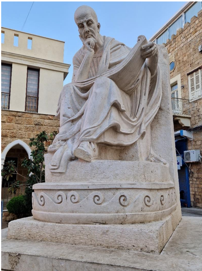
2.5 Modern standbeeld voor de Romeinse jurist Ulpianus