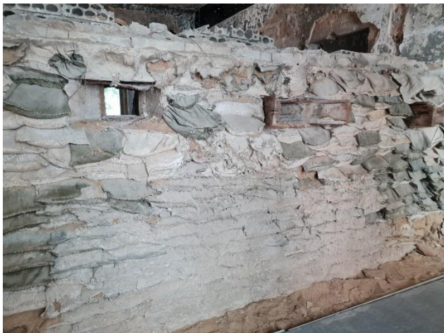
9.4 Stelling uit de Burgeroorlog (Beit Beirut)