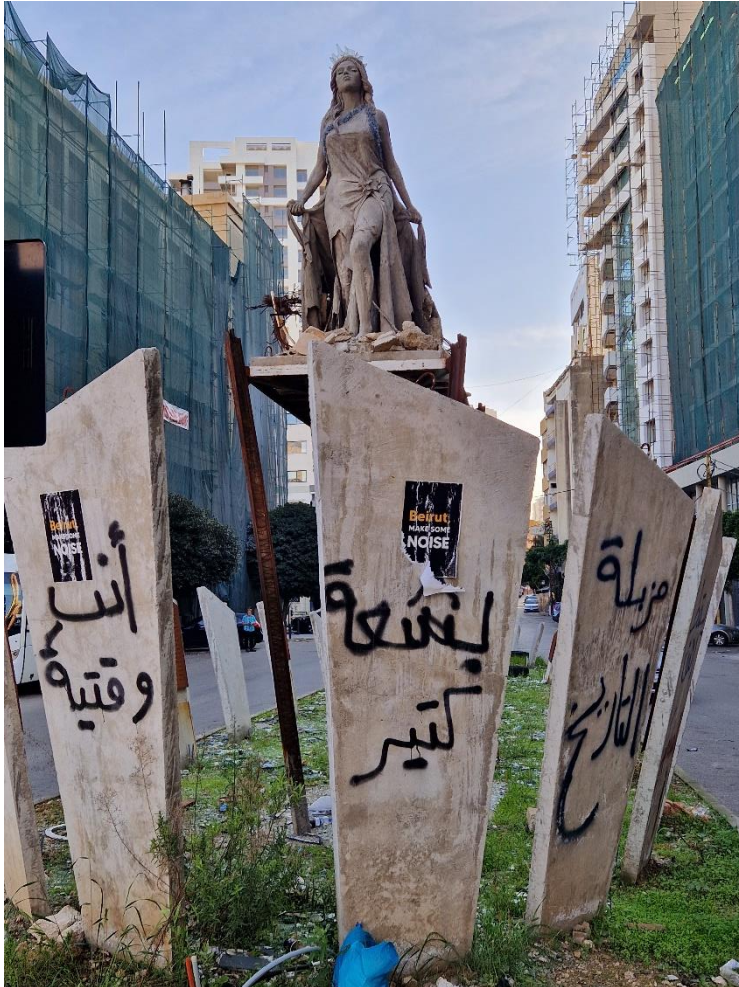
10.6 De personificatie van Beiroet staat als feniks op uit de as