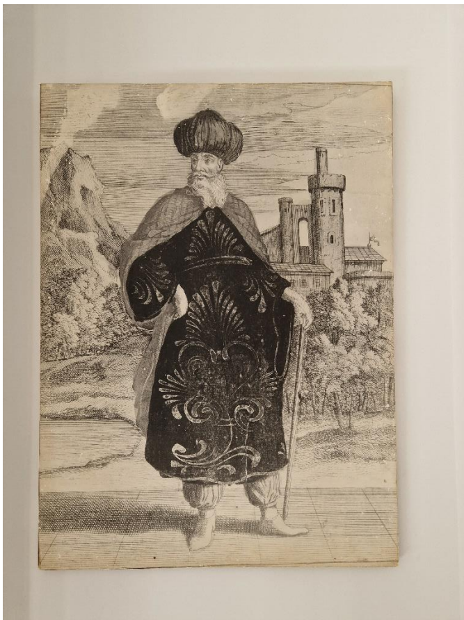
5.2 Fakhr ed-Din