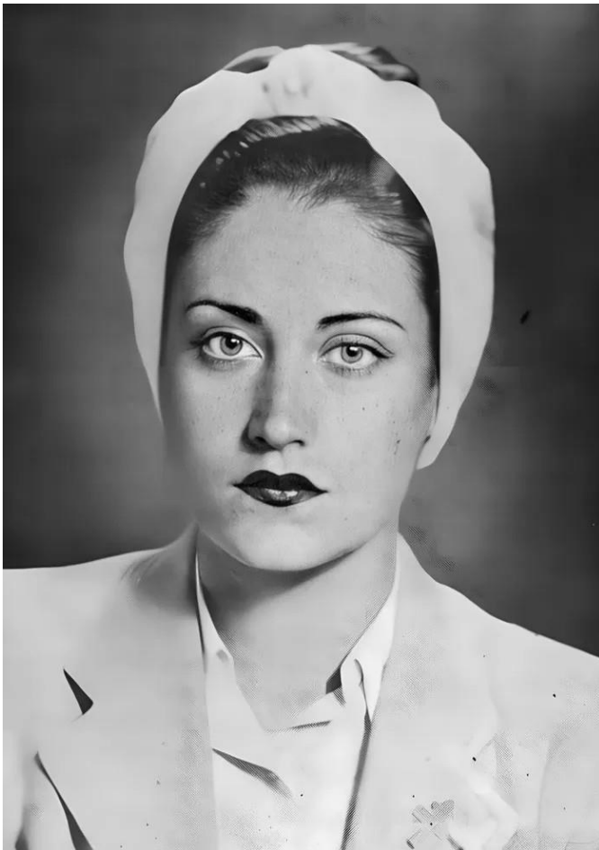
8.1 Asmahan met Kruis van Lotharingen