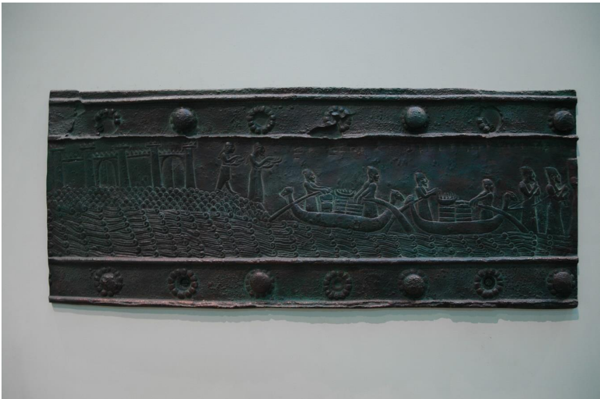
1.5 De stad Tyrus betaalt tribuut aan de Assyriërs