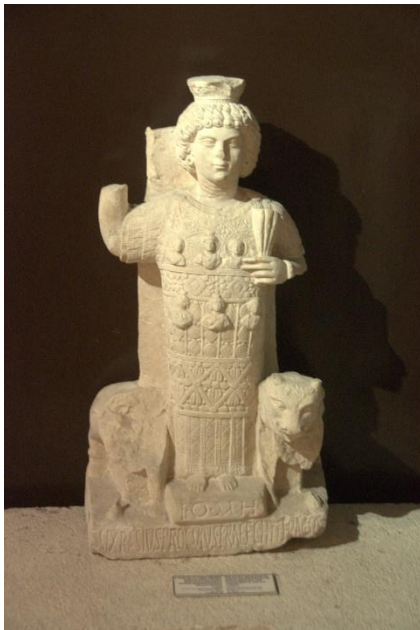
2.4 De Jupiter van Baalbek