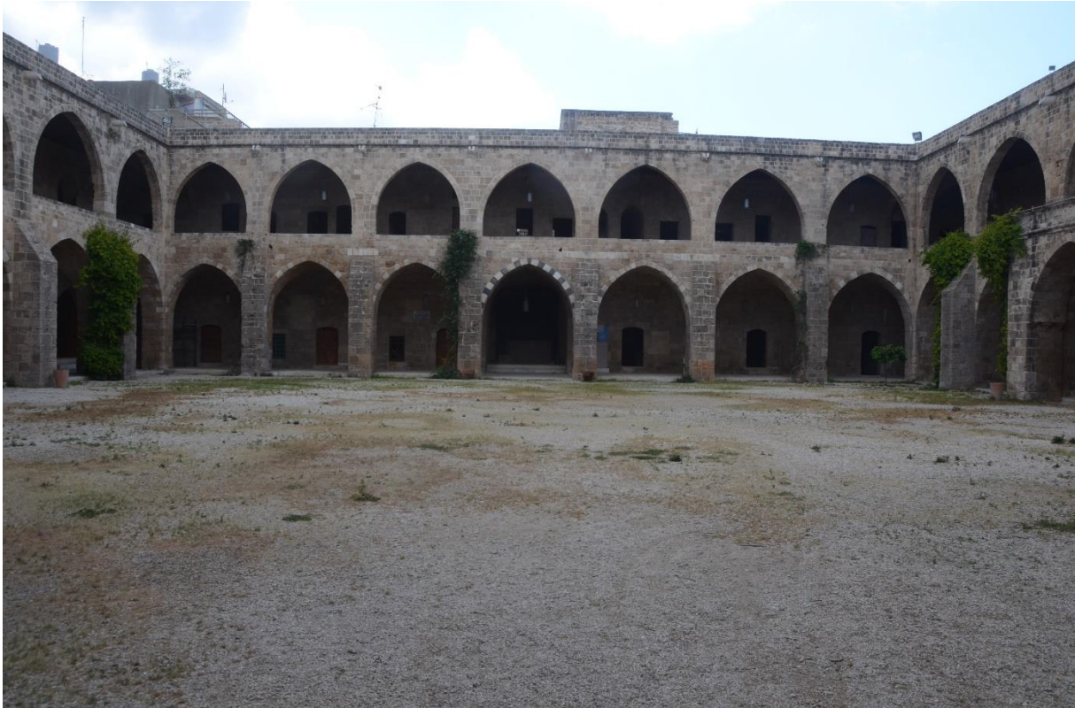
5.3 De khan van Sidon