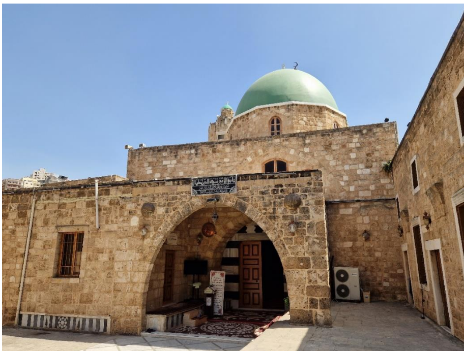
5.1 De Taynalmoskee in Tripoli