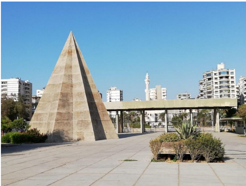
8.3 Het tentoonstellingsterrein van Oscar Niemeyer, Tripoli