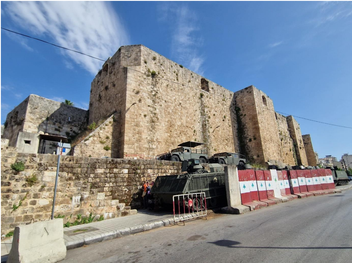
4.1 Het Kruisvaarderskasteel van Tripoli