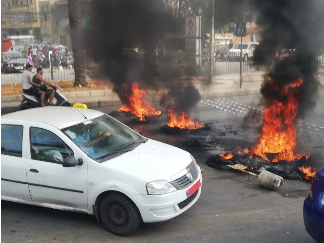
10.4 Gewelddadig protest in Beiroet, 2019