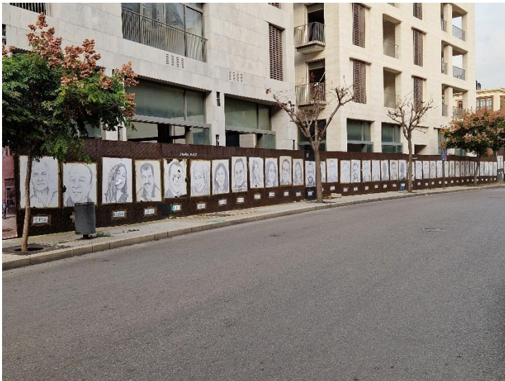
10.5 De portretten van de slachtoffers van de ontploffing van 4 augustus 2020