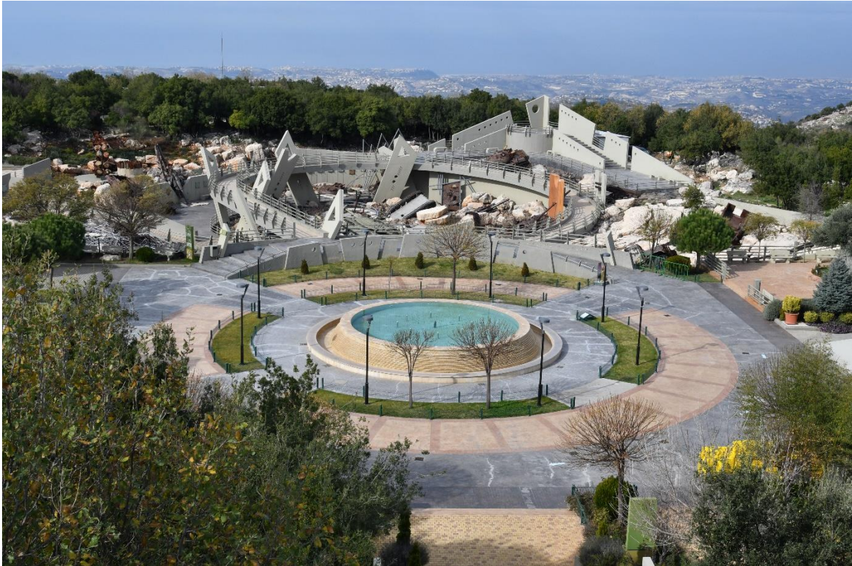
10.3 Het Hezbollah-museum Mleeta