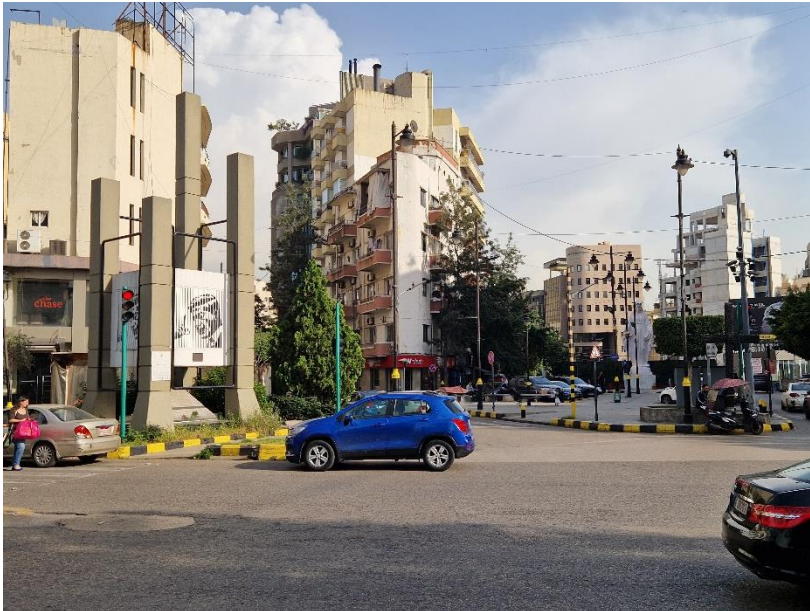
9.1 Monument voor de vermoorde president Bashir Gemayel (links)