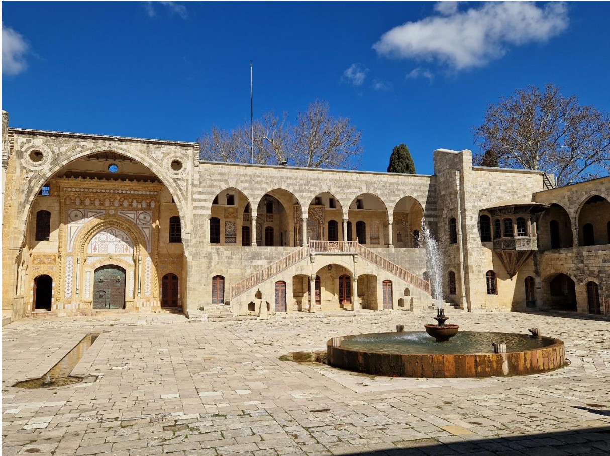
5.4 Het Beiteddin-paleis