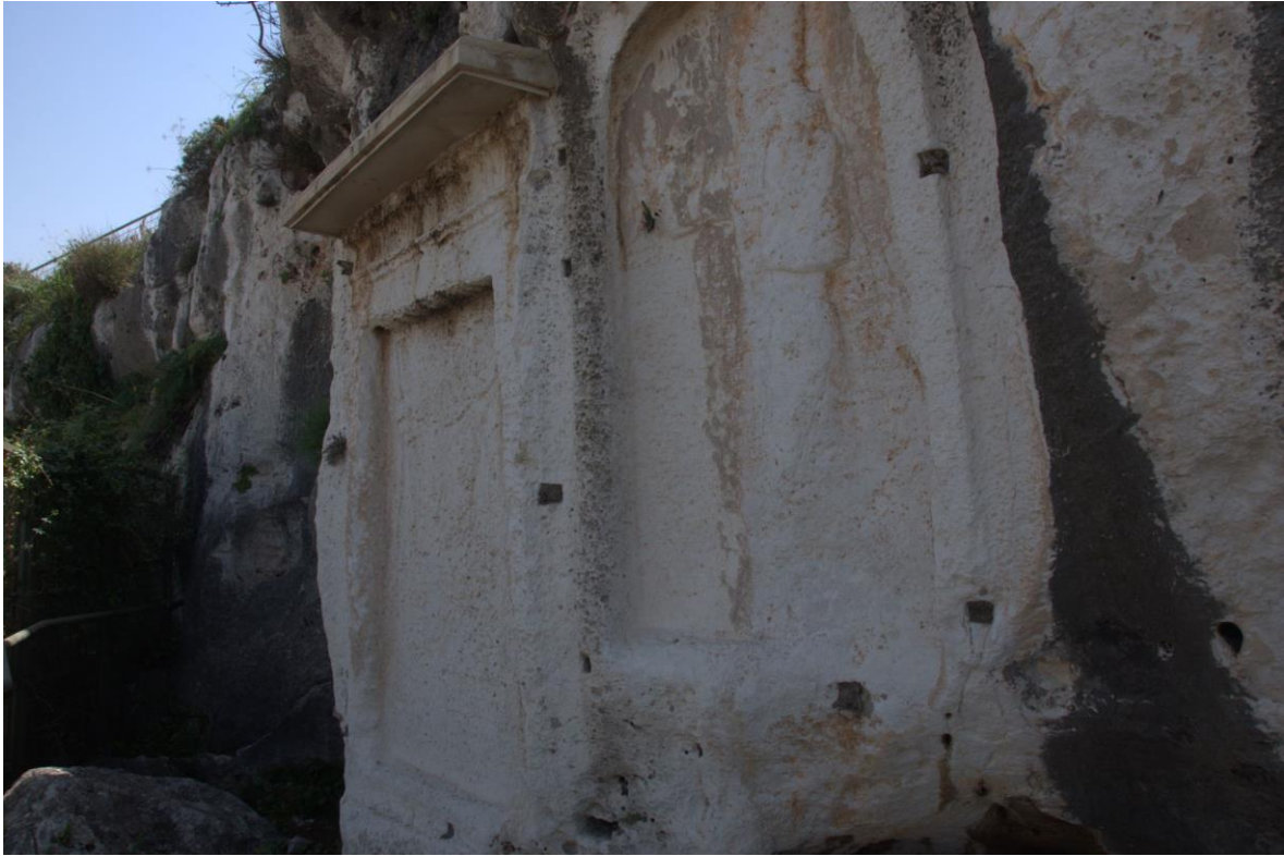
1.4 Egyptische en Assyrische reliëfs aan de Nahr al-Kalb