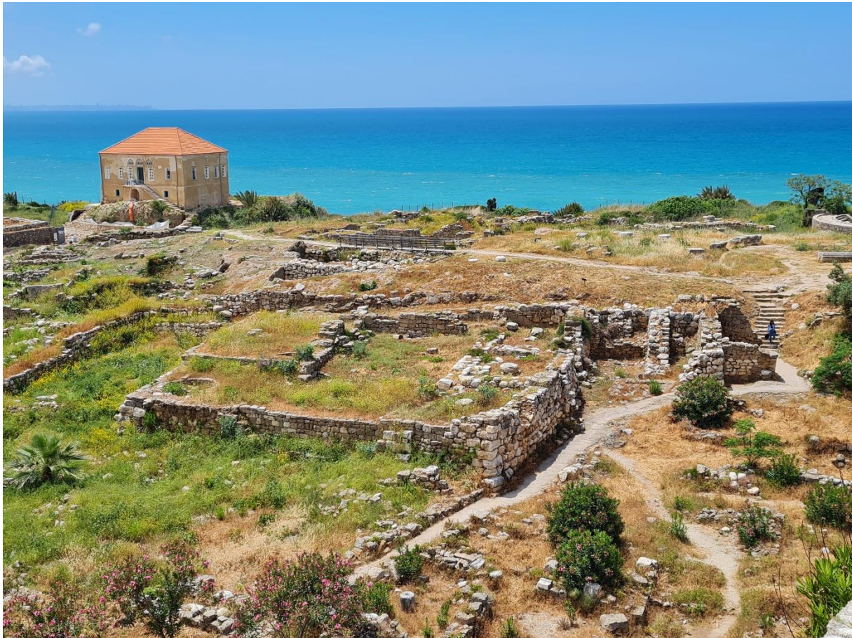
1.1 De opgraving van Byblos