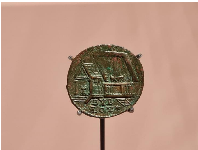
2.2 Munt van Byblos als heilige stad, met twee tempels