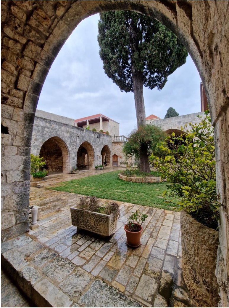
4.3 De abdij van Belmont