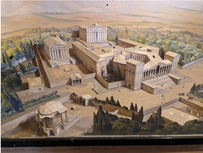
2.3 Maquette van de tempels van Baalbek