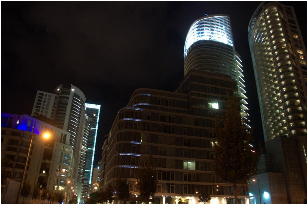
10.1 Moderne architectuur in Beiroet