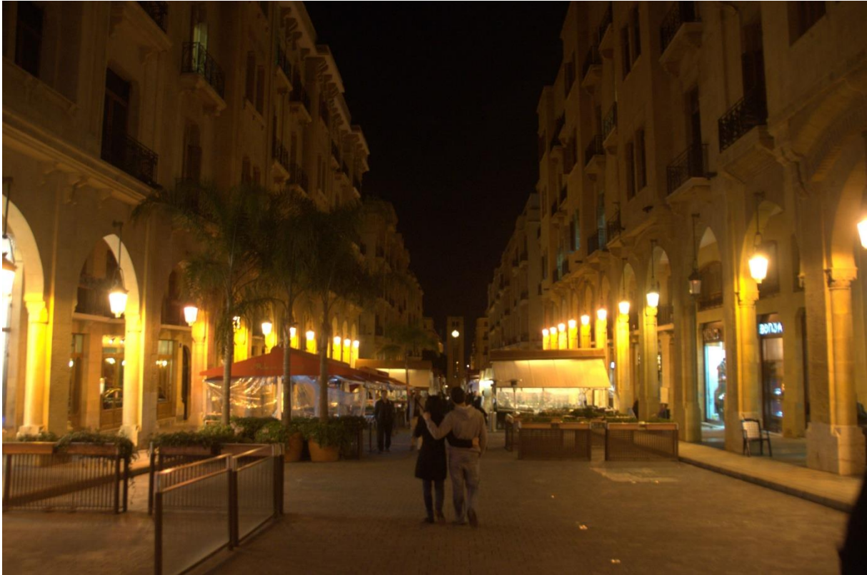
7.2 De Rue Maarad in Beiroet: kopie van de Rue de Rivoli in Parijs