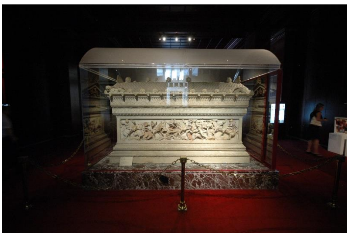
2.1 Alexandersarcofaag, Sidon