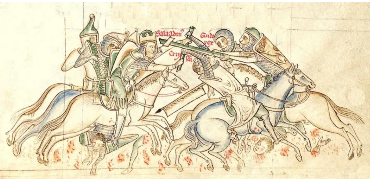
4.4 De slag bij Hattin