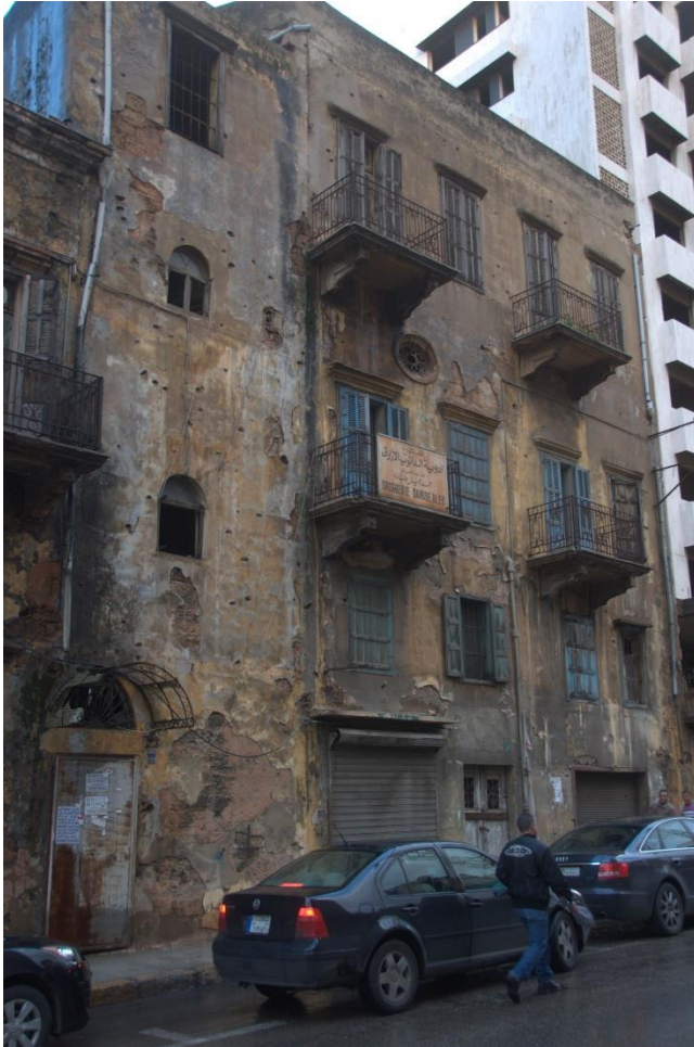
9.2 Nog altijd zichtbare oorlogsschade