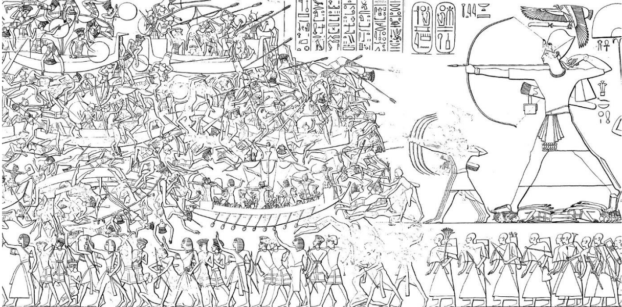
1.3 Ramses III bestrijdt de Zeevolken