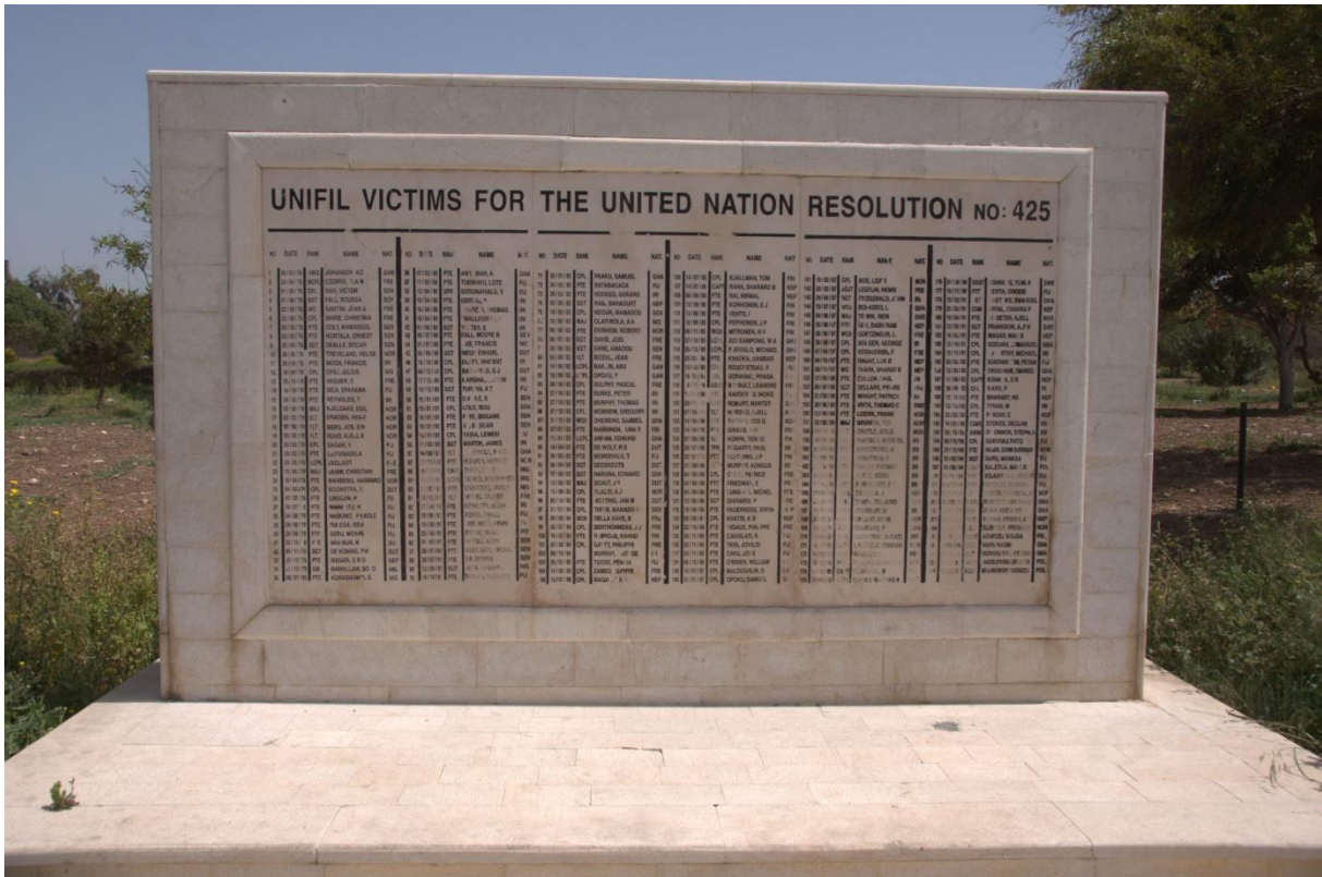
9.3 Monument voor Unifil (Tyrus)