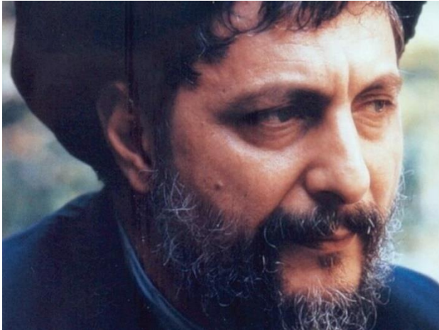
8.4 Musa Sadr