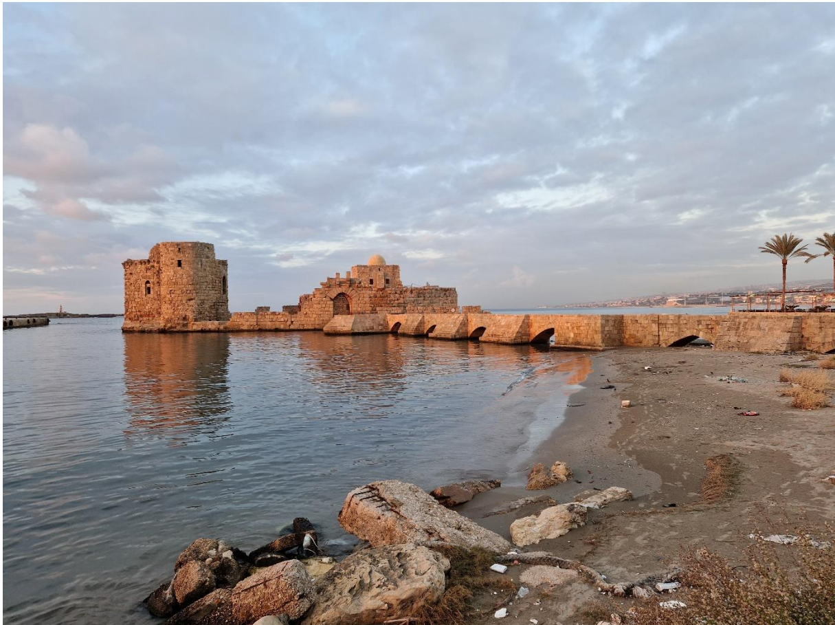
4.5 Het zeekasteel van Sidon