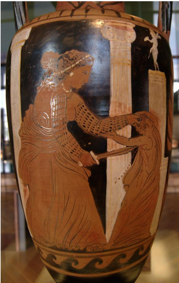
Medea vermoordt een van haar kinderen, Amfoor, ca. 330 v. Chr.