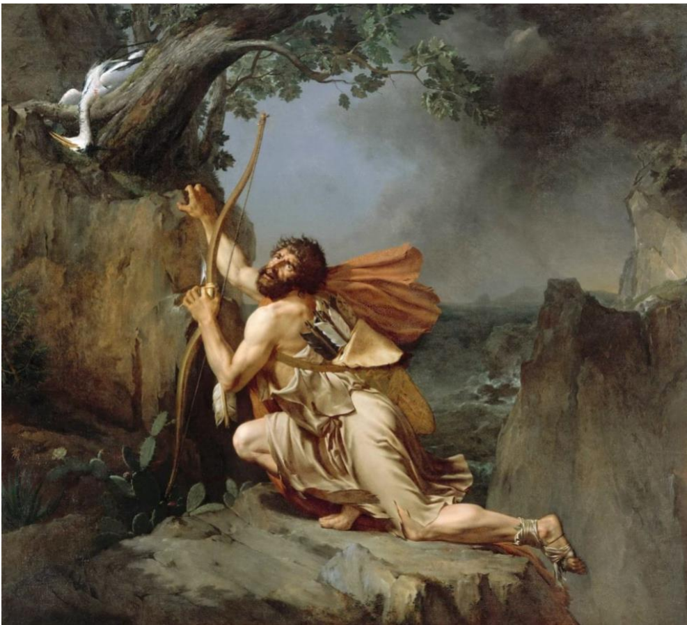
Guillaume Guillon Lethière, Philoctetes op het eiland Lemnos , 1798, Louvre, Paris, France.