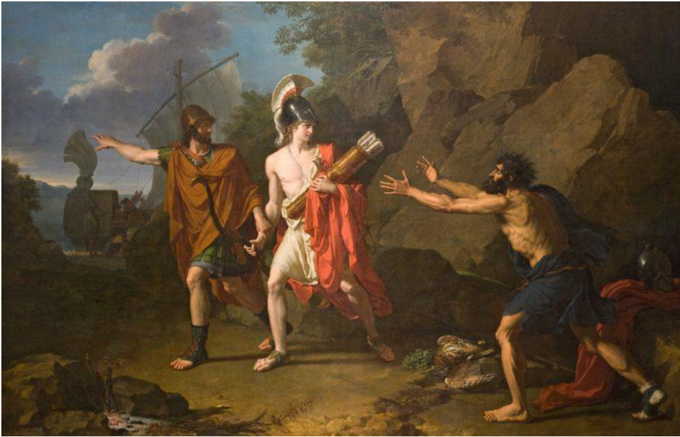
François Xavier Fabre, Odysseus en Neoptolemus nemen de boog en pijlen van Heracles over van Philoctetes , 1800, Musée Fabre, Montpellier, France.