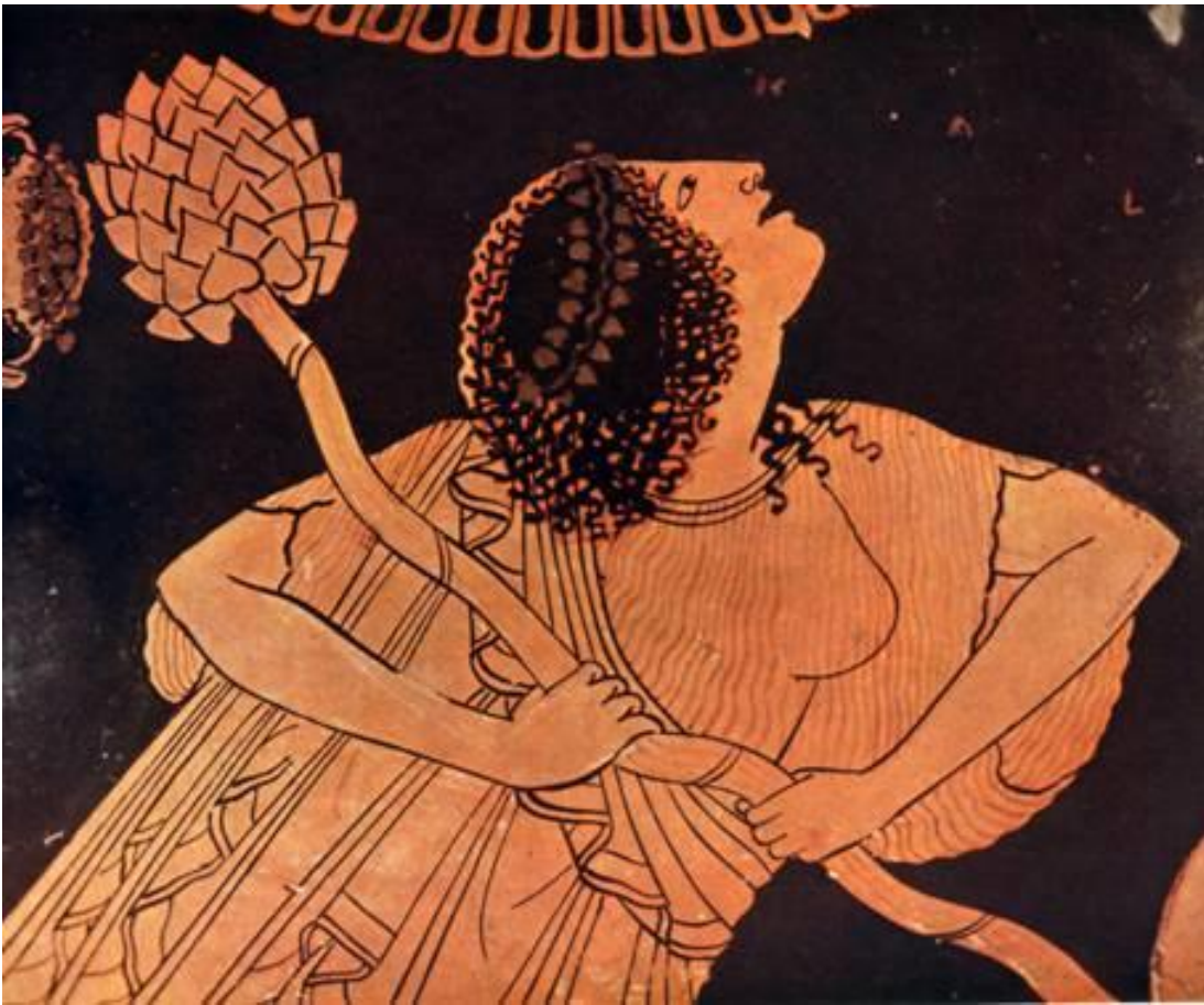
Bacchante met thyrsusstaf. Roodfigurige vaas, Cleophrades, ca. 500-490 v. Chr.