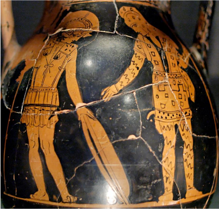
Glaucus (rechts) en Diomedes ruilen hun wapenrusting; ca 420 v. Chr.